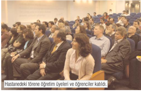
Hastanedeki törene öğretim üyeleri ve öğrenciler katıldı.