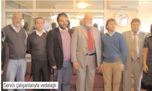
Servis çalışanlarıyla vedalaştı.