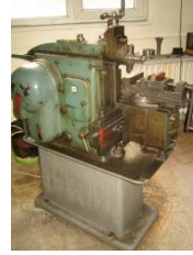
Torna – Freze Tezgahları